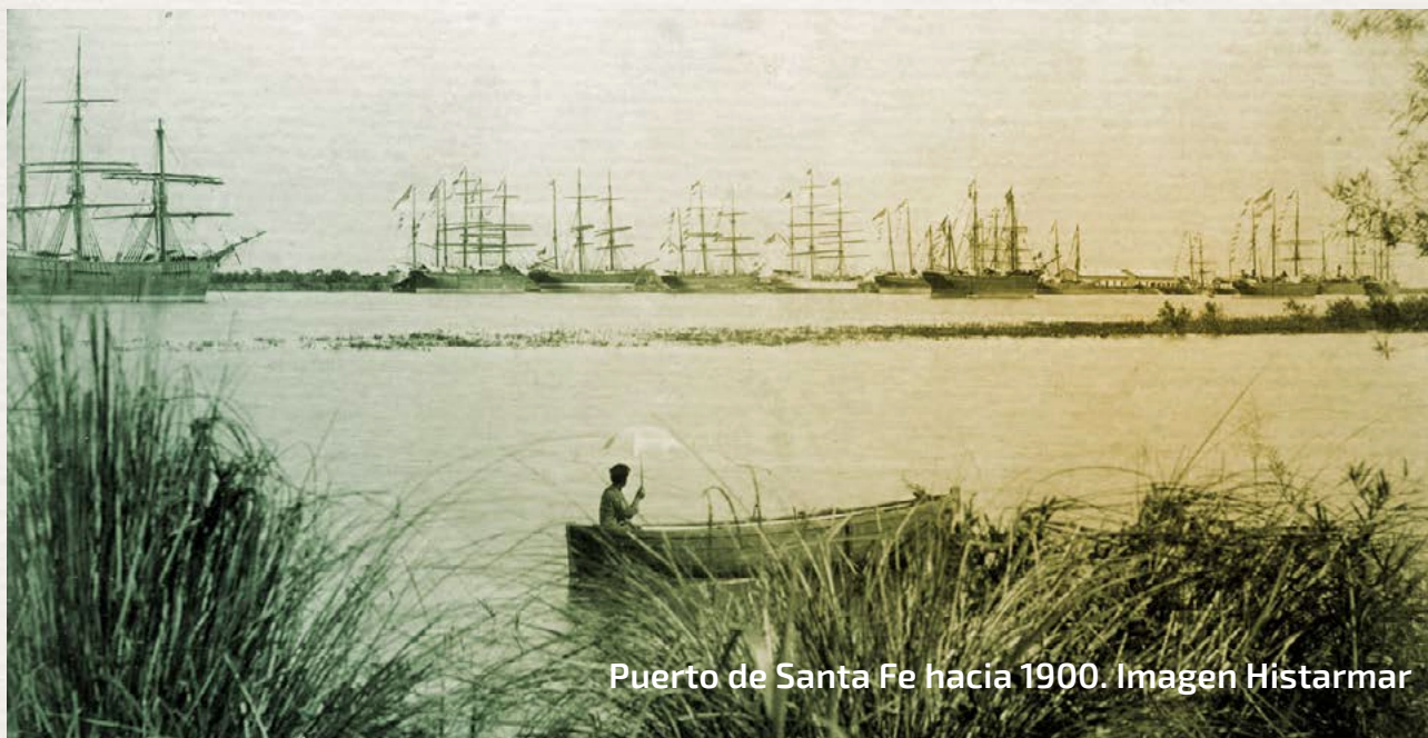
Puerto de Santa Fe hacia 1900.

tados sobre la ribera pasaran a la Municipalidad para reconciliar los intereses urbanos con el uso del río. Adoptemos el criterio de los recursos de la producción. La región de Rosario, tradicional punto de embarque de la producción cerealera argentina motivó el surgimiento de instituciones con un pasado centenario en la lucha por los intereses regionales, por ejemplo, la necesidad de mantener navegable y en profundidad el río Paraná. Se a esto le sumamos otra área de interfaces: por ejemplo, la vinculada con educación, la generación de recursos técnicos, de oficios, especialidades, universitarios para el abordaje de estas problemáticas: formaron profesionales ingenieros, arquitectos urbanistas, que participaron del proceso de refuncionalización del frente rosarino.