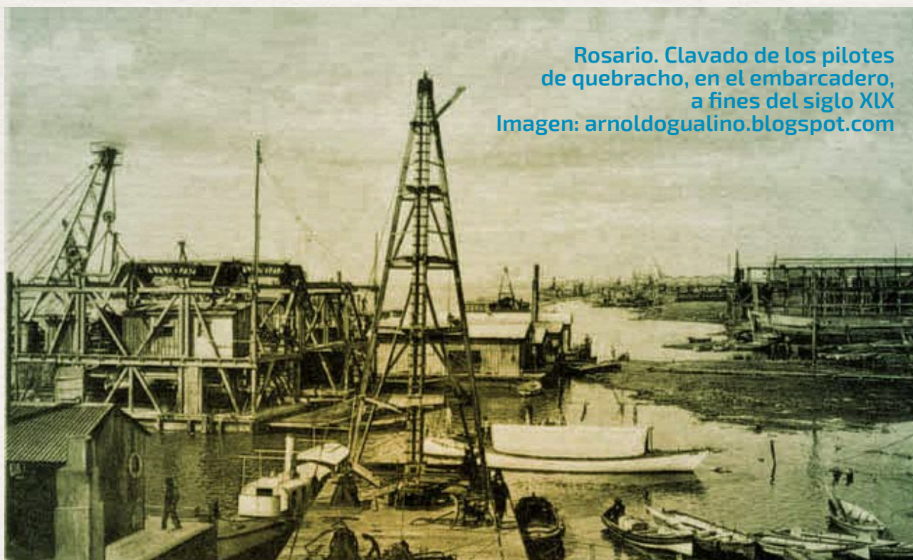
Rosario. Clavado de los pilotes de quebracho, en el embarcadero, a fines del siglo XIX

identidad portuaria una condición indispensable para el ejercicio de una gobernanza ciudad puerto sustentable.