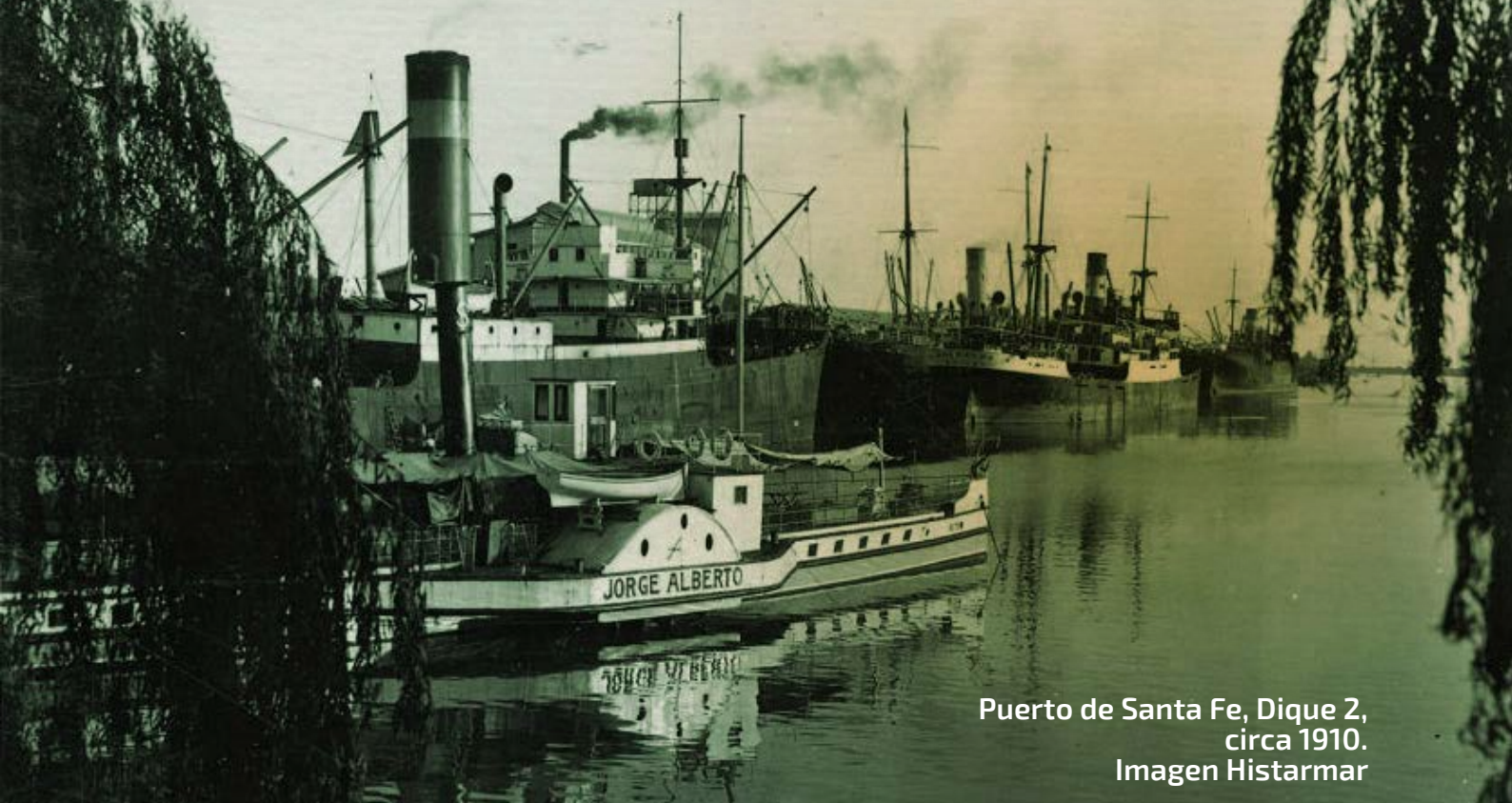
Puerto de Santa Fe, Dique 2, circa 1910.