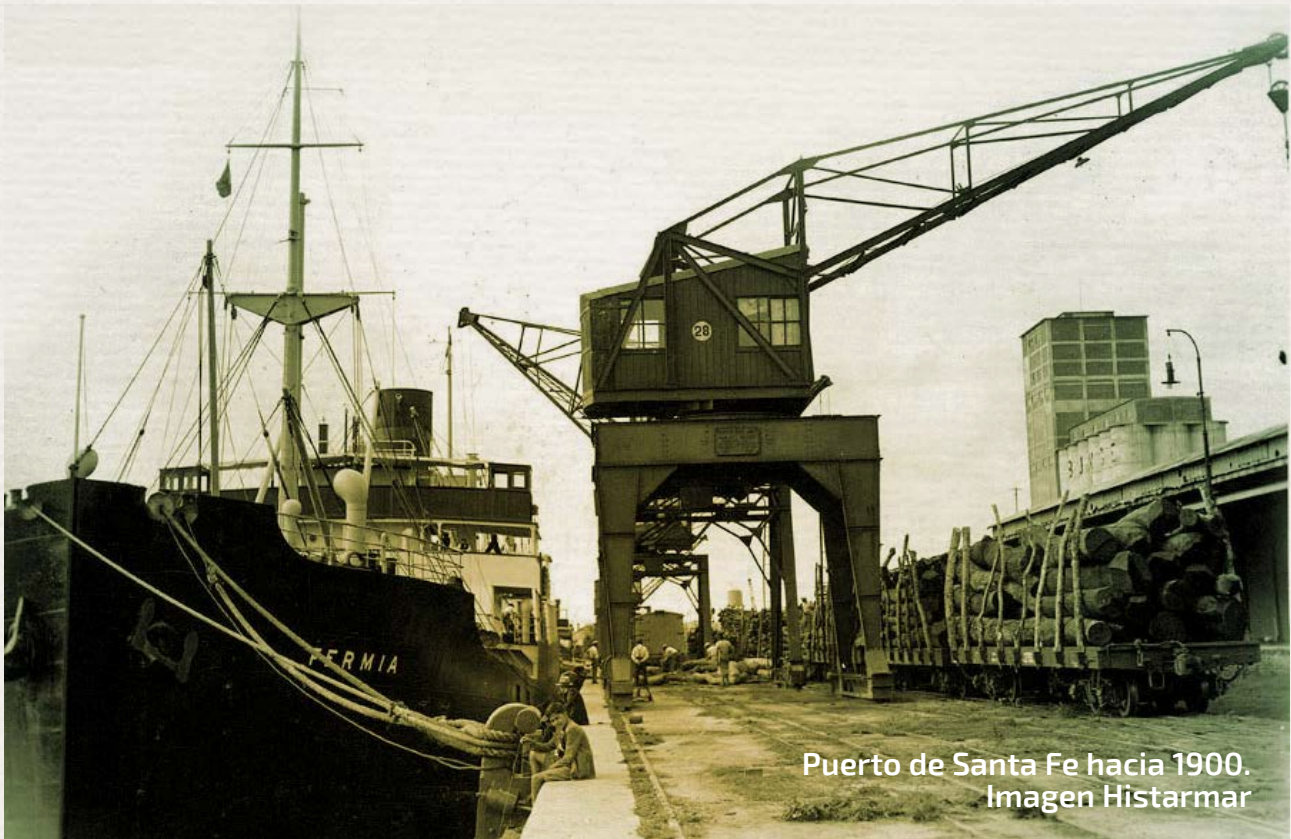
Puerto de Santa Fe hacia 1900.

tud por prestar su colaboración comprendiendo las posibilidades del mismo para contribuir a una gobernanza ciudad puerto región sustentable de sensible impacto en la Argentina.