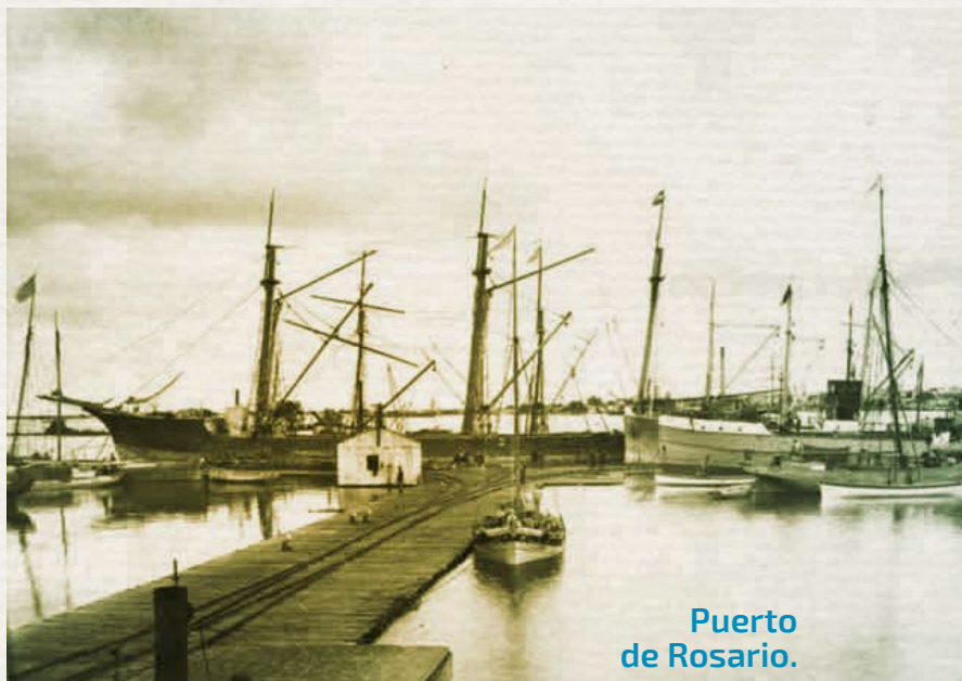
Puerto de Rosario.

Así como es común escuchar de los asistentes a las conferencias públicas organizadas de que “no se reconocen habitantes de una ciudad portuaria por no tener acceso directo a la rivera”, siendo la actividad portuaria en este caso una barrera y no un puente, por extensión podría decirse que muchos de los que no