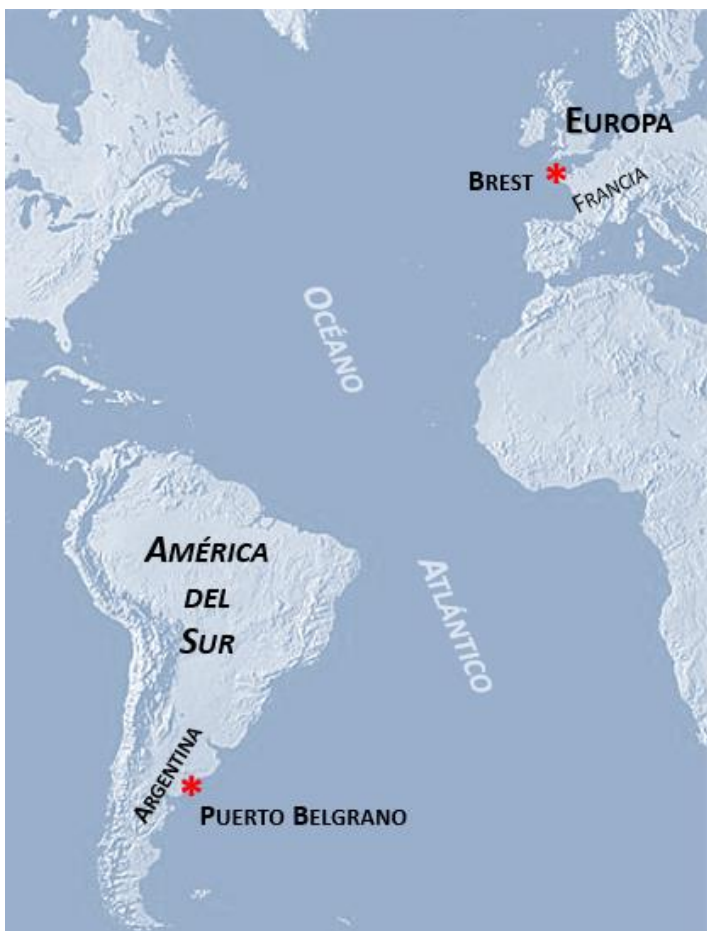
Figura 1: Ubicación de Brest y Puerto Belgrano.

En este artículo, los autores desean estudiar cómo el equipamiento de los puertos y especialmente los diques de carena puede ser un indicador relevante de la evolución de los puertos para la historia de la ciencia y la tecnología. Como estudio de caso, se llevará a cabo una comparación entre los diques de dos arsenales militares: Brest en Francia y Puerto Belgrano en la Argentina.